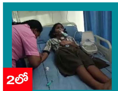
సూర్య బాత్ రూంలో యాసిడ్?