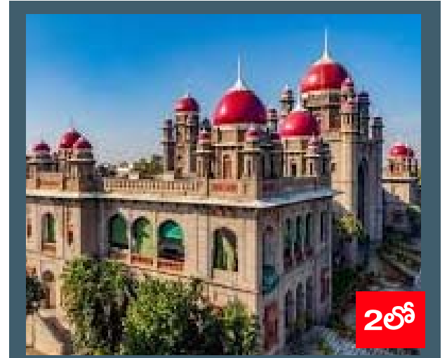
తెలంగాణ తల్లి విగ్రహ ఏర్పాటుపై వివాదం