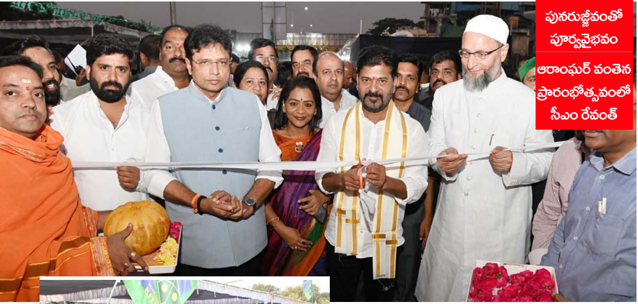
చార్లినార్ పాదచారుల ప్రాజెక్టుకు నిధులు మెట్రో విస్తరణ, మూసీ పునరుజ్జీవంతో పూర్వవైభవం ఆరాంఘర్ వంతెన ప్రారంభోత్సవంలో సీఎం రేవంత్

“హైదరాబాద్ లో చార్లినార్ ప్రాంతాన్ని అంతా పాతబస్తీ అంటున్నారు. ఇదే అసలైన నగరం. ఘనమైన చారిత్రక నేపథ్యమున్న ఈ ప్రాంత అభివృద్ధికి రూ.వేల కోట్లు ఖర్చు చేయాలి. మెట్రో విస్తరణ, మూసీ పునరుజ్జీవంతో పూర్వ వైభవం తీసుకొస్తాం” అని సీఎం రేవంత్ రెడ్డి హామీ ఇచ్చారు. జూలై నుంచి ఆరాంఘర్ పరకు రూ.799.74 కోట్లతో నిర్మించిన 4 కిలోమీటర్ల పొడవైన ఫైజ్ వర్ను ఆయన సోమవారం ప్రారంభించారు. ఎంపీ అసదుద్దీన్ ఓవైసీ సూచన మేరకు... ఈ ఫైజ్ వర్నుకు మాజీ ప్రధాని మన్మోహన్ సింగ్ పేరును పెడుతున్నట్లు ప్రకటించారు. ఈ సందర్భంగా సీఎం మాట్లాడారు. “చర్లపల్లి రైల్వే టెర్మినల్ ప్రారంభోత్సవం సందర్భంగా ప్రధాని మోదీ ఆన్ లైన్ లో మాట్లాడారు. మెట్రో రైల్ విస్తరణకు, ఆర్ఆర్ఆర్ కు, మూసీ పునరుజ్జీవ పథకానికి వేగంగా అనుమతులివ్వాలని అభ్యర్థించాం. పరేళ్లలో ఎంజీబీఎస్-రాంధ్రాయణగుట్ట మెట్రో మార్గంలో ఇటుక కూడా వేయలేదని ఆయన దుష్టత తీసుకొన్నారు. వీటిపై కేంద్ర క్యాబినెట్ లో చర్చించాలని కోరాం. కాంగ్రెస్ అధికారంలోకి వచ్చాక భూసేకరణ ప్రక్రియను పూర్తిచేశాం. ఎన్నికలప్పుడే రాజకీయాలు... అభివృద్ధి పథంలో వెళ్లేటప్పుడు కేంద్రంలో భాజపాతో కలిసి నడుస్తాం. ఇక్కడ మజ్జిన్ తోనూ ముందుకెళ్తాం. ఉస్మానియా ఆసుపత్రిని గోషామహల్ కు తరలించనున్నాం. అక్కడ అత్యాధునిక సౌకర్యాలతో నిర్మించనున్న ఆసుపత్రికి వారం రోజుల్లోనే